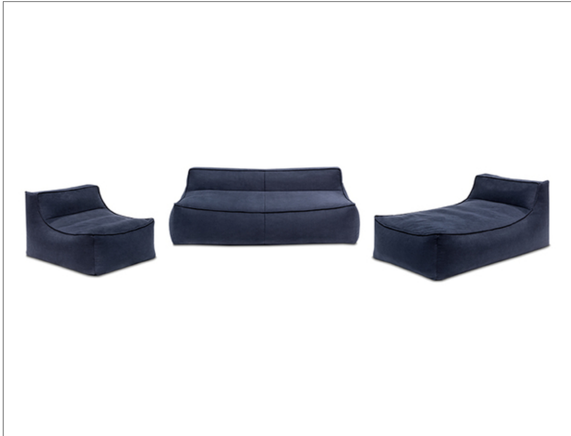
M707 Bounty REC+2+Sessel A040 Freisteller L