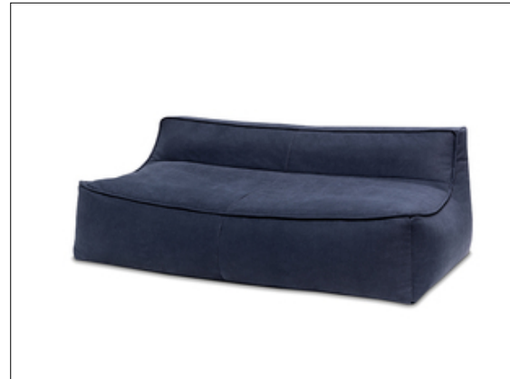
M707 Bounty 2 A040 Freisteller L