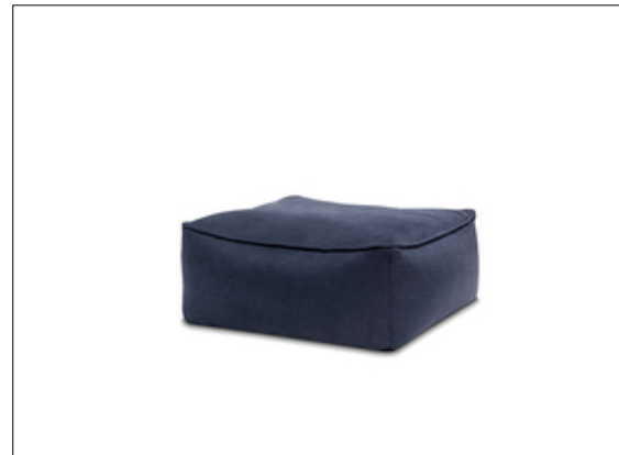
M707 Bounty HO A040 Freisteller L