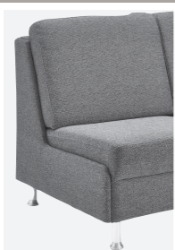
Abschlussblende alternativ zu einem Armteil möglich (Mehrpreis)