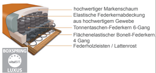
Boxspringsitz mit Bonell-Federkern und Tonnentaschenfederkern