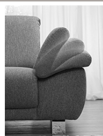
AT 1 - wahlweise klappbar gegen Aufpreis