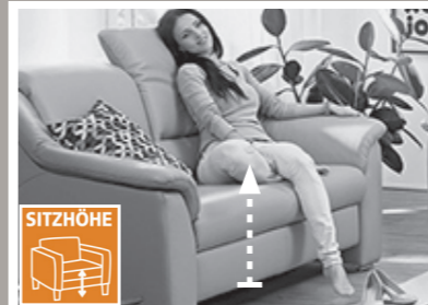
2 Sitzhöhen zur Auswahl