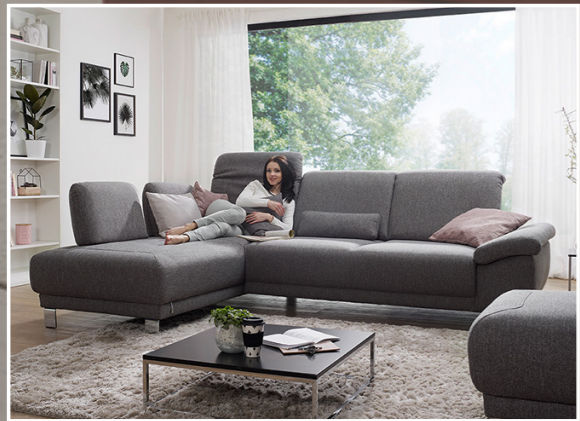
Zahlreiche Kombinations- und Bezugsvarianten möglich!