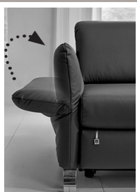
AT 2 - immer klappbar (Mehrpreis)