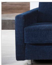
Armlehne Typ 1