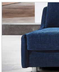
Armlehne Typ 2