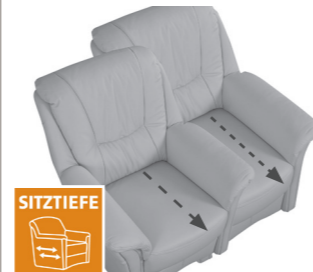
2 Sitztiefen zur Auswahl Sitztiefe L (53cm) oder Sitztiefe K (48cm)