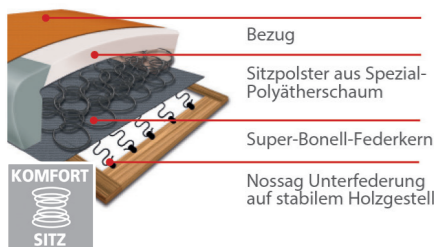
Komfortsitz mit Federkern