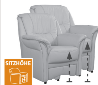
2 Sitzhöhen zur Auswahl Sitzhöhe 46 oder 49cm