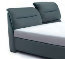
0848KV Höhe 112cm - 123cm gegen Aufpreis nur lieferbar bei Bettgrößen 160-200cm Breite