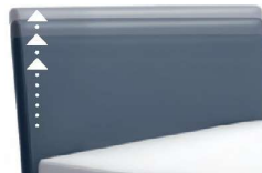
0300 Multimaß Höhe 55 - 125 cm in 5cm-Schritten kürzbar gegen Aufpreis