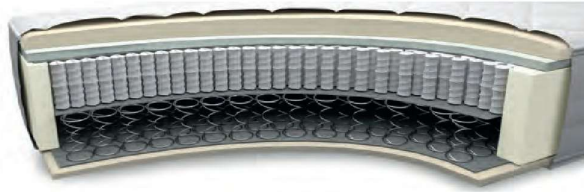
MA750VA gegen Aufpreis