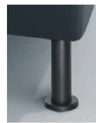
M 24-10 M 24-15 Metallfuß schwarz preisgleich