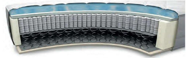
MA750GA gegen Aufpreis