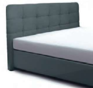
0830 Höhe 122cm preisgleich