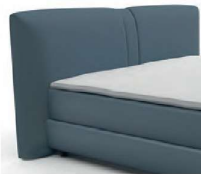
0314 Höhe 119 cm Standard