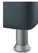
K 01-10 K 01-15 Kunststofffuß alufarbig Standard