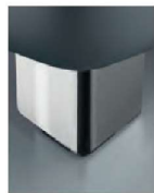
M 09-10 M 09-15 Metallfuß preisgleich