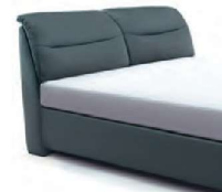
0848 Höhe 112cm preisgleich nur lieferbar bei Bettgrößen 160-200cm Breite