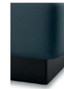
S 08-10 S 08-15 Bettsockel schwarz preisgleich