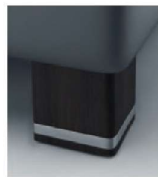
H 05-10 H 05-15 Holzfuß wengefarbig preisgleich