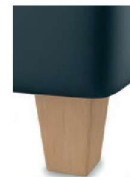
H 17-10 H 17-15 Holzfuß natur lackiert preisgleich