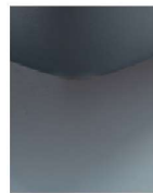
K08-10 K08-15 Schwebeoptik preisgleich