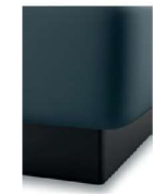
S 07-10 S 07-15 Bettsockel schwarz preisgleich