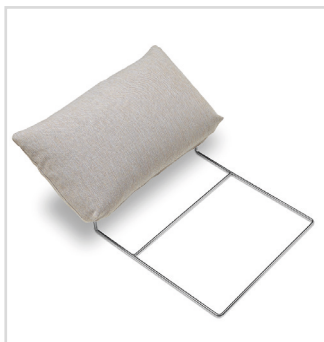
Anwendungsbeispiel Kopfstütze Nummer 1