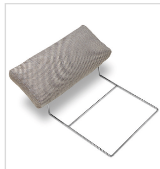
Anwendungsbeispiel Kopfstütze Nummer 2