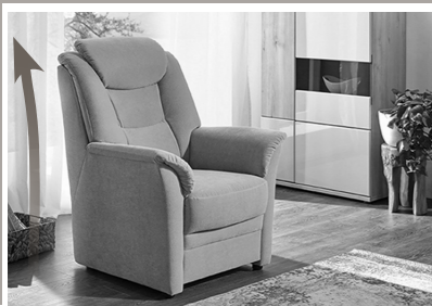
Extra hohe Rückenlehne