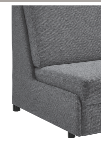
Abschlussblende alternativ zu einem Armteil möglich (Mehrpreis)