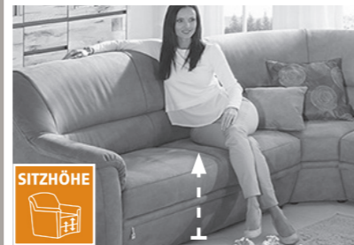
3 Sitzhöhen zur Auswahl

3 Sitzhöhen durch unterschiedlich hohe Möbelgleiter. Nicht möglich bei Funktionselementen. Dadurch ändert sich auch die Rückenhöhe.