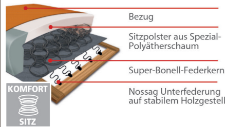
Komfortsitz mit Federkern