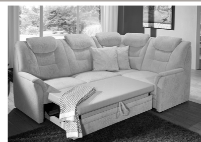
Querschläfer (Mehrpreis, Auszug ist optional im Originalbezug (echt) möglich)