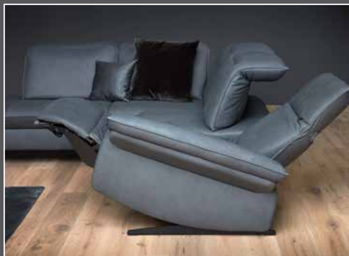
Variante 86 • elektrischer Fußteilverstellung • elektrischer Sitztiefenverstellung • Herz-Waage-Funktion (optional)