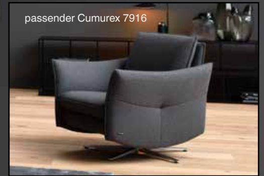
passender Cumurex 7916