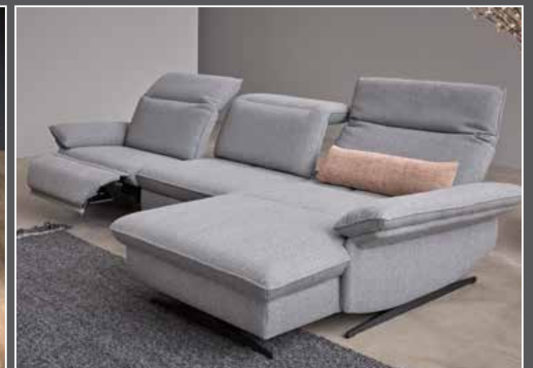
Zusammenstellung 21/28 in 30 O2 Oasis polar • elektrischer Fußteilverstellung im äußeren Sitz • elektrischer Sitztiefenverstellung • manuelle Kopfteilverstellung