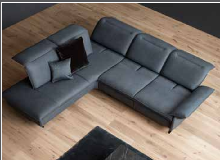
Variante 77: Sitztiefenverstellung an der kurzen Seite Variante 86: Sitztiefenverstellung in beiden Sitzen