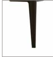
Metallfuß verschie- dene Metallfarben