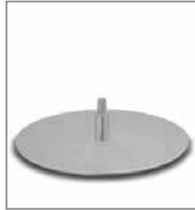
Drehteller Chrom matt Optik