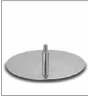
Drehteller Chrom glänzend