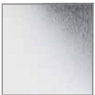
Chrom glän- zend