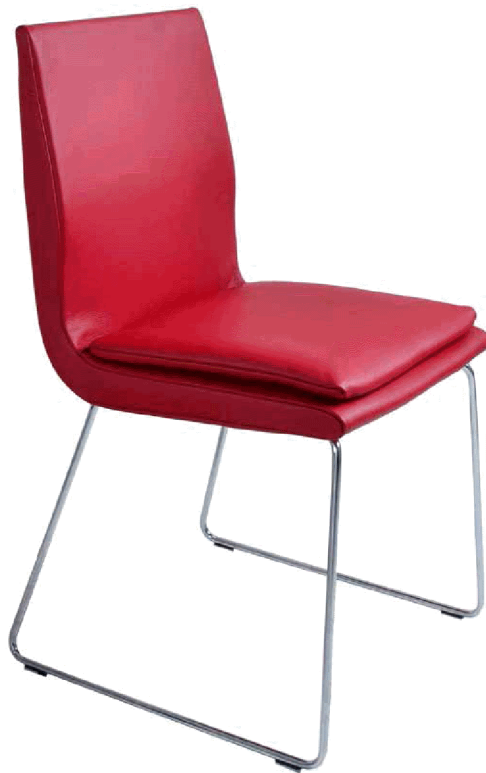
1A Stuhl mit Kufen in Edelstahloptik