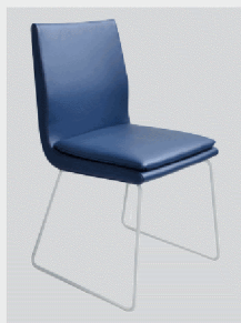
Kufe Metall weiß-matt