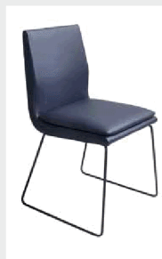
Kufe Metall schwarz Struktur