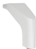
Metalleckfüße Nickel satiniert

Typen mit AT 1 - Longchair li/re vorne und Recamiere li/re offene Seite: