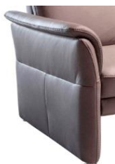
AT 1 bodennah (standardmässig)