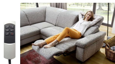
Handschalter liegt auf dem Sitz.

Hinweis: alle Sofas in Verbindung mit TV Funktion motorisch Premium werden grundsätzlich geteilt und in 2 Packstücken geliefert.