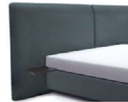
1996 Höhe 129 cm mit 2 Ablagetischen