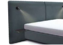
1996 Höhe 129 cm mit 2 Ablagetischen und 2 Lampen schwarz