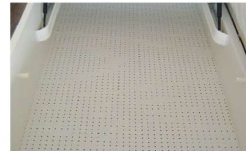
inkl. gelochter Bodenplatte für optimale Luftzirkulation