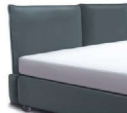
1857 Höhe 106 cm *