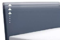
1300 Höhe 55 - 125 cm in 5 cm-Schritten kürzbar