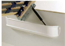
inkl. Luxus-Gasdruckfeder zum Öffnen des Lattenrahmens und Nutzung des Stauraums (nicht in Verbindung mit Motorlattenrahmen)