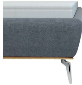
leicht konisch mit Sichtholzrahmen Wildeiche geölt - nur bei Fußhöhe 16 cm lieferbar - Höhe ca. 26 cm inkl. Sichtholzrahmen