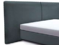
1996 Höhe 129 cm