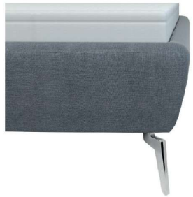
leicht konisch ohne Sichtholzrahmen Höhe ca. 24 cm