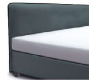
1869 Höhe 116 cm * inkl. Keder