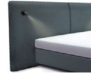
1996 Höhe 129 cm mit 2 Lampen schwarz