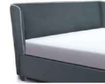
1871 Höhe 107 cm * inkl. Keder