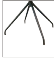
Stativfuß drehbar schwarz, Aufpreis