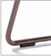
Drahtrohrgestell schwarz pulverbesch.