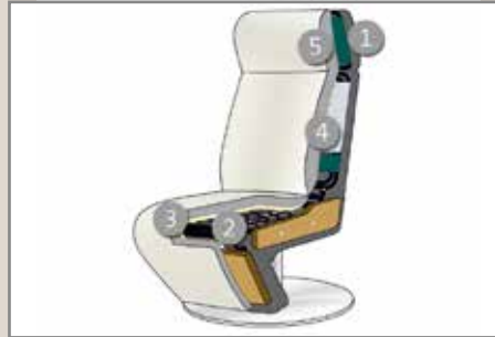
Das Design des hier abgebildeten Querschnitts entspricht nicht dem Modell dieses Katalogblattes.