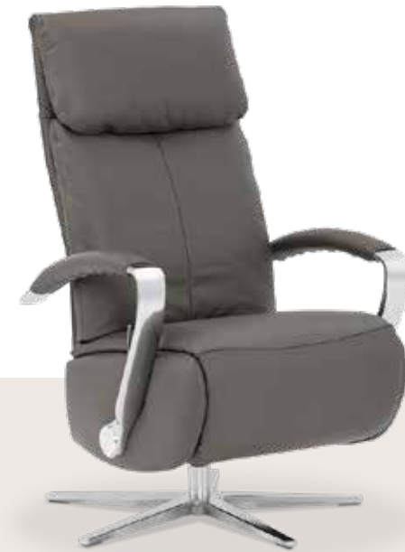
Bezug: Z73/95 graphit

Dieser Alleskönner punktet durch verschiedenste Komfortfunktionen . Der Sessel ist als Small-, Medium- oder Large-Variante erhältlich. Die Sitz- /Rückenverstellung ermöglicht es - optional auch elektrisch - ganz relaxt die Seele baumeln zu lassen. Ein farblich abgesetzter Kontrastfaden kann auf Wunsch verarbeitet werden.