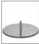
Drehteller versch. Metallf. Mehrpreis 3 Sitzh.