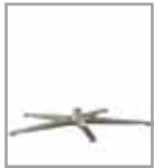
5-Sternfuß versch. Metallf. 3 Sitzh.