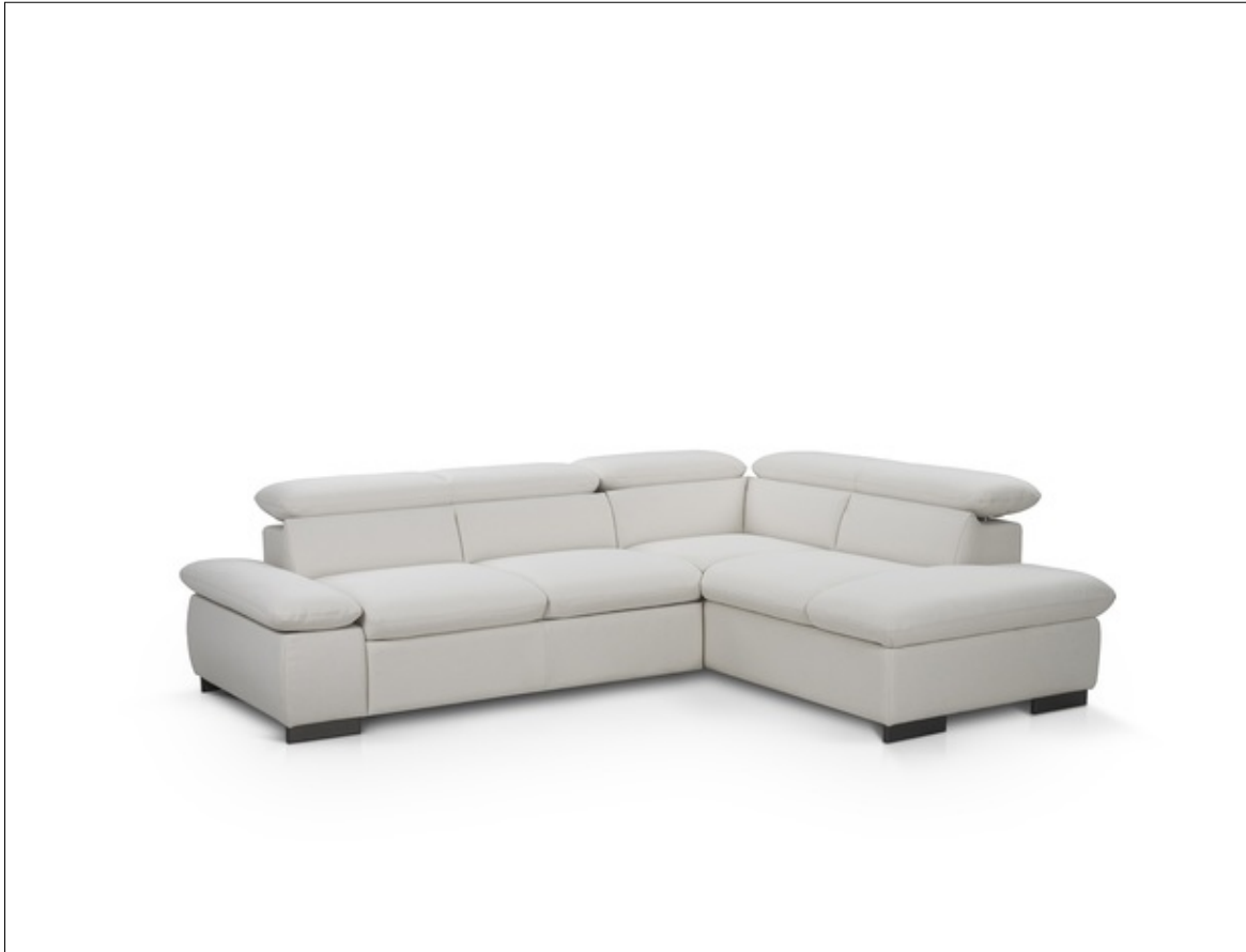
County 2F-OTM-BK-klein F040 Freisteller L