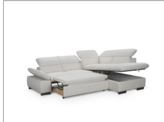
County 2F-OTM-BK-klein F040 Freisteller L Funktion